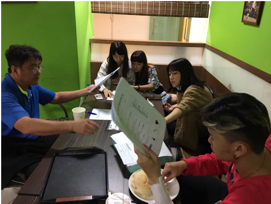
團隊教學準備照片