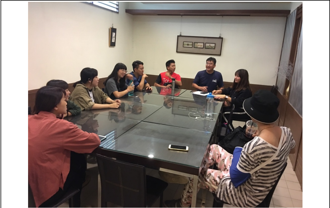
團隊籌備會議照片